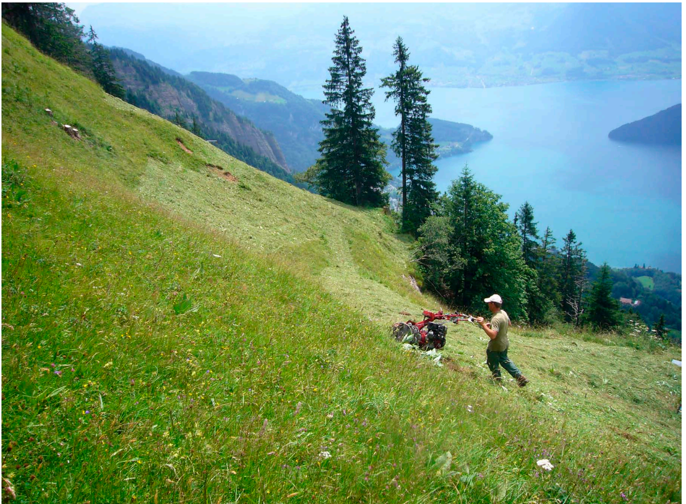
Abb. 1: TWW-Bewirtschaftung am Rigi.

La recherche à l'aide des critères choisis a révélé un nombre important d'études susceptibles d'être pertinentes. Il a fallu par la suite vérifier si ces publications étaient réellement pertinentes et avaient la qualité scientifique voulue. Sur la base des résumés, les études ont été classées en trois catégories: hautement pertinentes, pertinentes et peu pertinentes. Seules les deux premières catégories ont été retenues. Des indications bibliographiques provenant de publications traitant des aspects pratiques de la conservation de la nature ont également été intégrées dans l'évaluation. En tout, 181 publications parues entre 1992 et 2010 ont été passées en revue.