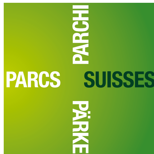
Abb. 2: Das neue Pärkelabel (französisch).

Labels «Parc» et «Produit»: Un parc se voit reconnu d'importance nationale dès que la Confédération lui octroie le label «Parc», à la demande du canton. Le label est octroyé pour une durée de dix ans lorsque l'exploitation du parc est assurée à long terme par des mesures efficaces et que les exigences légales sont remplies. Afin de promouvoir l'économie régionale selon les principes du développement durable, les organes responsables du parc disposent du label «Produit». Celui-ci garantit le caractère «local» et «durable» des ressources, le but étant de créer une plus-value régionale en commercialisant des biens et services locaux.