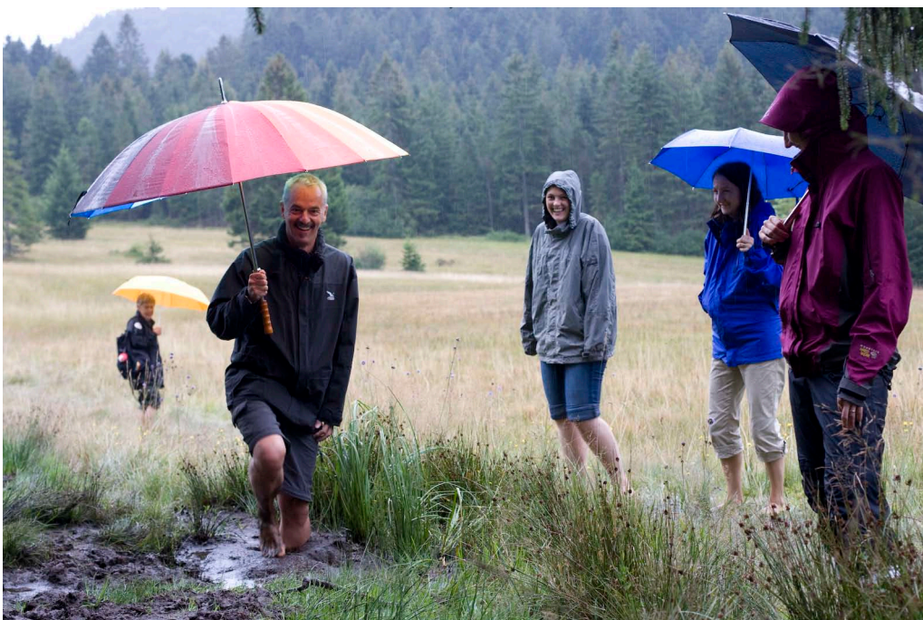
Abb. 1: Barfussweg Rietbach.

(1989). Cette théorie postule que, dans la nature, l'énergie dépensée habituellement par l'homme pour rester attentif diminue du fait que les interactions avec la nature stimulent l'intérêt sans demander d'effort physique et psychique. Au contraire, ces interactions auraient un effet régénérateur. Il n'y a pas très longtemps que ce potentiel est pris en compte dans les études de planification, aux côtés des fonctions écologiques et productives de la nature. C'est pourtant une dimension du paysage et de l'espace non bâti