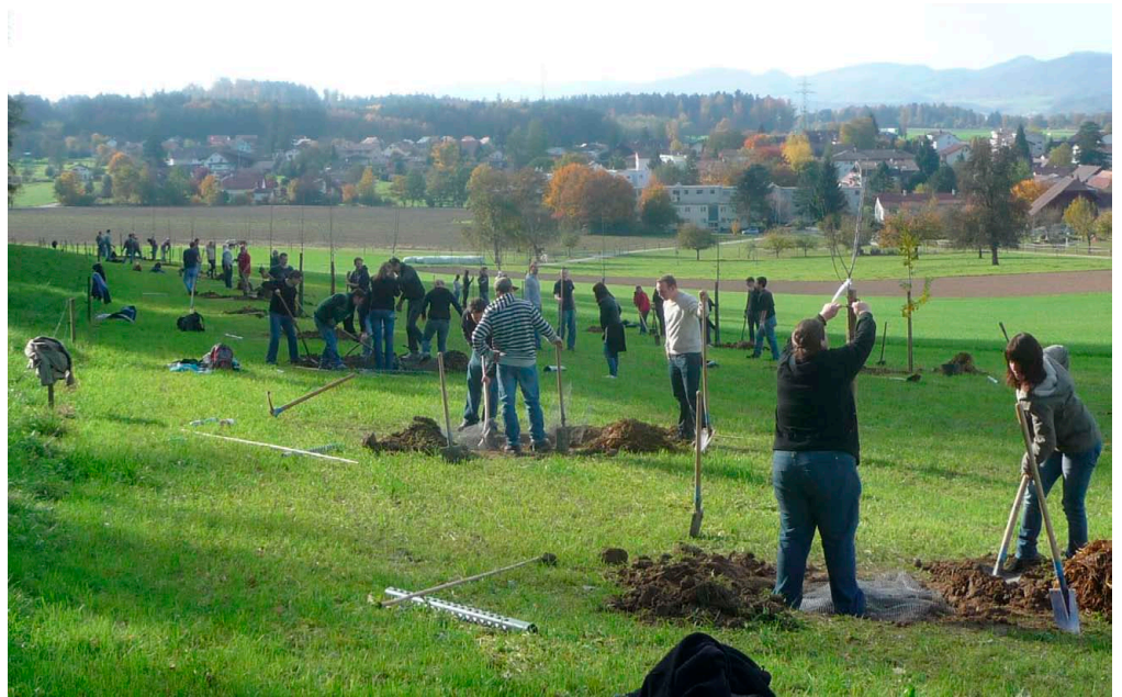
Abb. 2: Hochstammobstbaumpflanzung mit 100 Studenten. Ganzheitliche Gesundheitsförderung für Körper, Sozialverhalten und Psyche. (Foto: Victor Condrau).

Das Institut für Landschaft und Freiraum entwickelt auf den Ergebnissen der Grundlagenforschung in verschiedenen Forschungsprojekten anwendungsbezogene Angebote für spezifische Nutzer- und Akteursgruppen in periurbanen, suburbanen und städtischen Landschafts- und Freiräumen. Die Projekte werden interdisziplinär bearbeitet, mit Partnerhochschulen aus der Sozialwissenschaft, Landwirtschaft und Hortikultur, namentlich u. a. der Hochschule für Soziale Arbeit Olten und der Zürcher Hochschule für angewandte Wissenschaften. Die