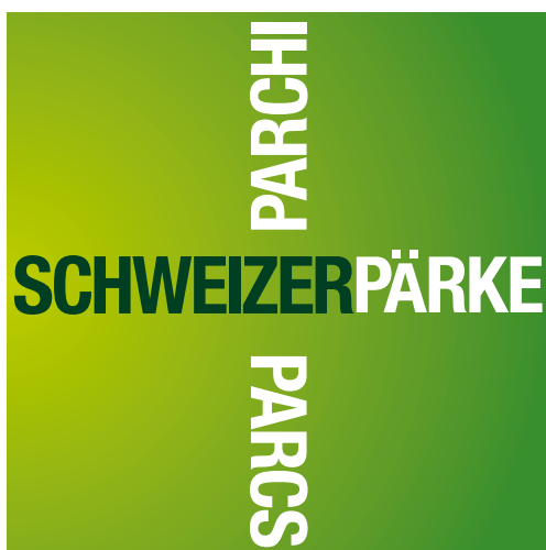
Abb. 1: Das neue Pärkelabel (deutsch).

L'OFEV est chargé de promouvoir et de faire connaître les parcs d'importance nationale. Ces parcs comprennent les trois catégories Parc national, Parc naturel régional et Parc naturel périurbain. Les bases légales nécessaires à la création de parcs d'importance nationale sont en vigueur depuis fin 2007. Au moyen d'aides financières globales, la Confédération soutient la création, la gestion et l'assurance de la qualité des parcs et leur donne une reconnaissance par l'octroi du label «Parc» (voir encadré). Tous les parcs sont le fruit d'une démarche volontaire de la part de communes et de régions. Ils sont