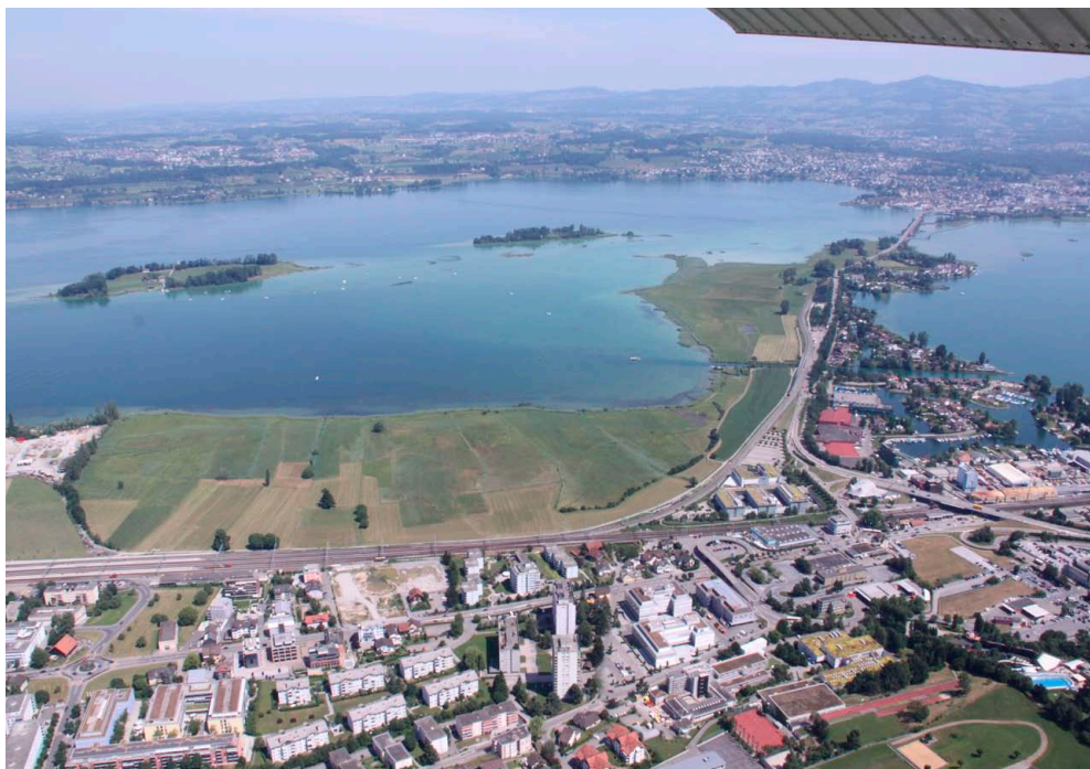
Abb.1: Biologische Vielfalt in der Schweiz unter Druck von allen Seiten (Beispiel: Frauenwinkel SZ). Die Umsetzung der Biodiversitätsziele 2020 muss verstärkt zum Thema werden. Soeben sind dazu neue Grundlagen erschienen.

De nouvelles bases scientifiques ont été établies pour concrétiser les Objectifs d'Aichi dans le cadre des politiques fédérales et cantonales en matière de protection de la nature: un rapport du bureau d'ingénieurs Gruner SA sur l'impact des Objectifs pour la biodiversité 2020 sur la politique de la Suisse en matière de biodiversité recense, pour chacun des vingt Objectifs, ses fondements dans l'optique de la Convention sur la diversité biologique et dresse un état des lieux de la situation en Suisse. Il montre aussi quelle est la marge de manœuvre et propose un premier groupe d'indicateurs permettant de vérifier la réalisation de chaque objectif. Le rapport ainsi qu'un document établi sur cette base par l'ASPO/BirdLife Suisse, Pro Natura et le WWF Suisse montrent que les Objectifs pour la biodiversité 2020 vont bien au-delà du plus connu d'entre eux, à savoir 17 % de zones protégées d'ici 2020 (liens Internet vers les documents cités à la fin de l'article).