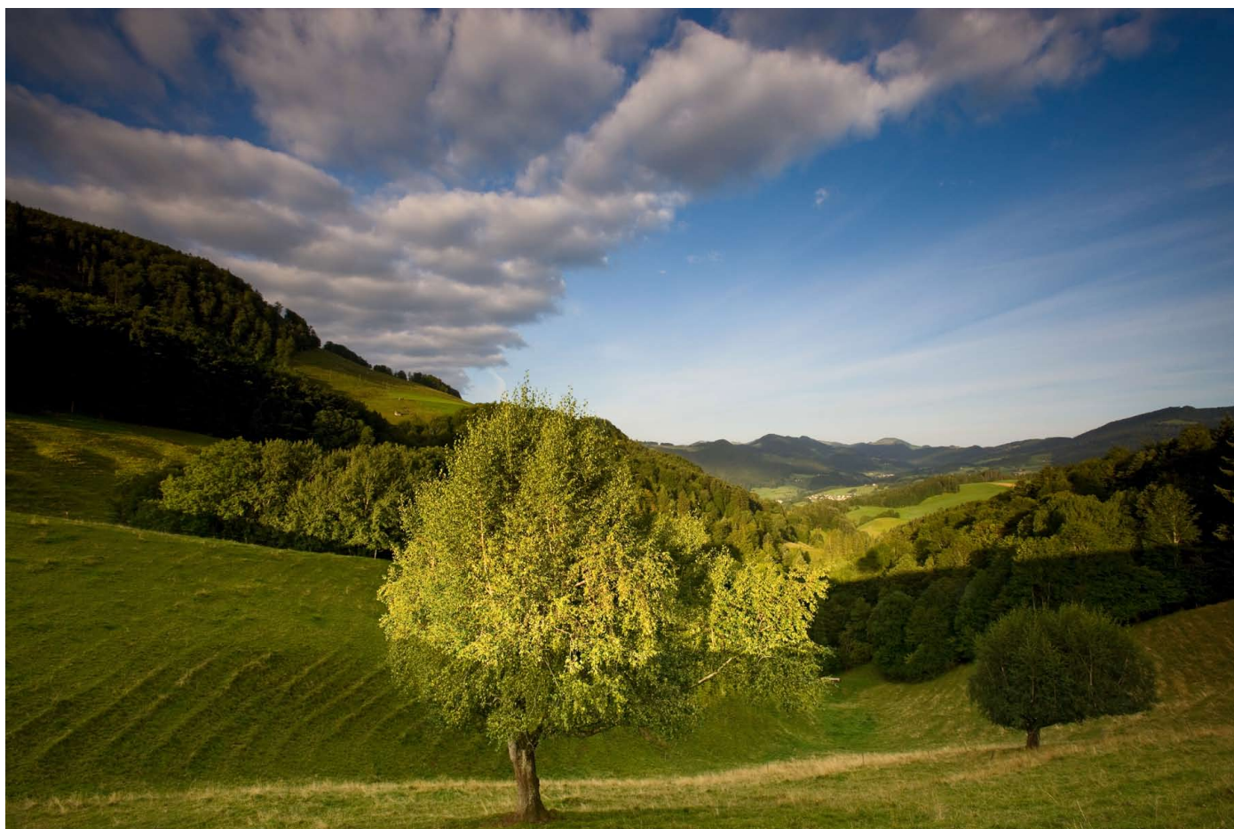
Abb. 3: Der regionale Naturpark Thal im Kanton Solothurn. Das Guldental hinter der zweiten Jurakette, in weiter Ferne Muemliswil.