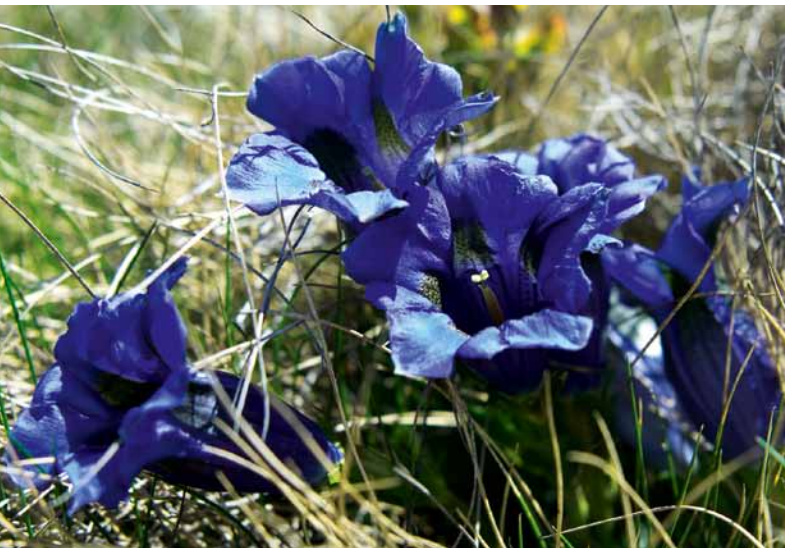
Der Enzian ist eine der Zeigerarten für biologische Qualität.