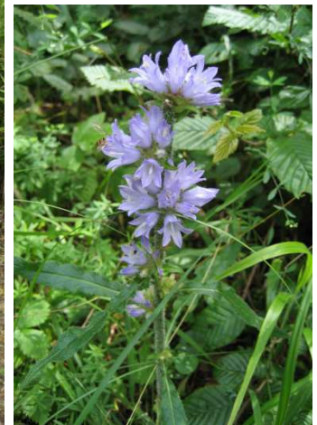
Campanula cervicaria , Niderholz Solhau, ZH © Adrienne Frei 2009