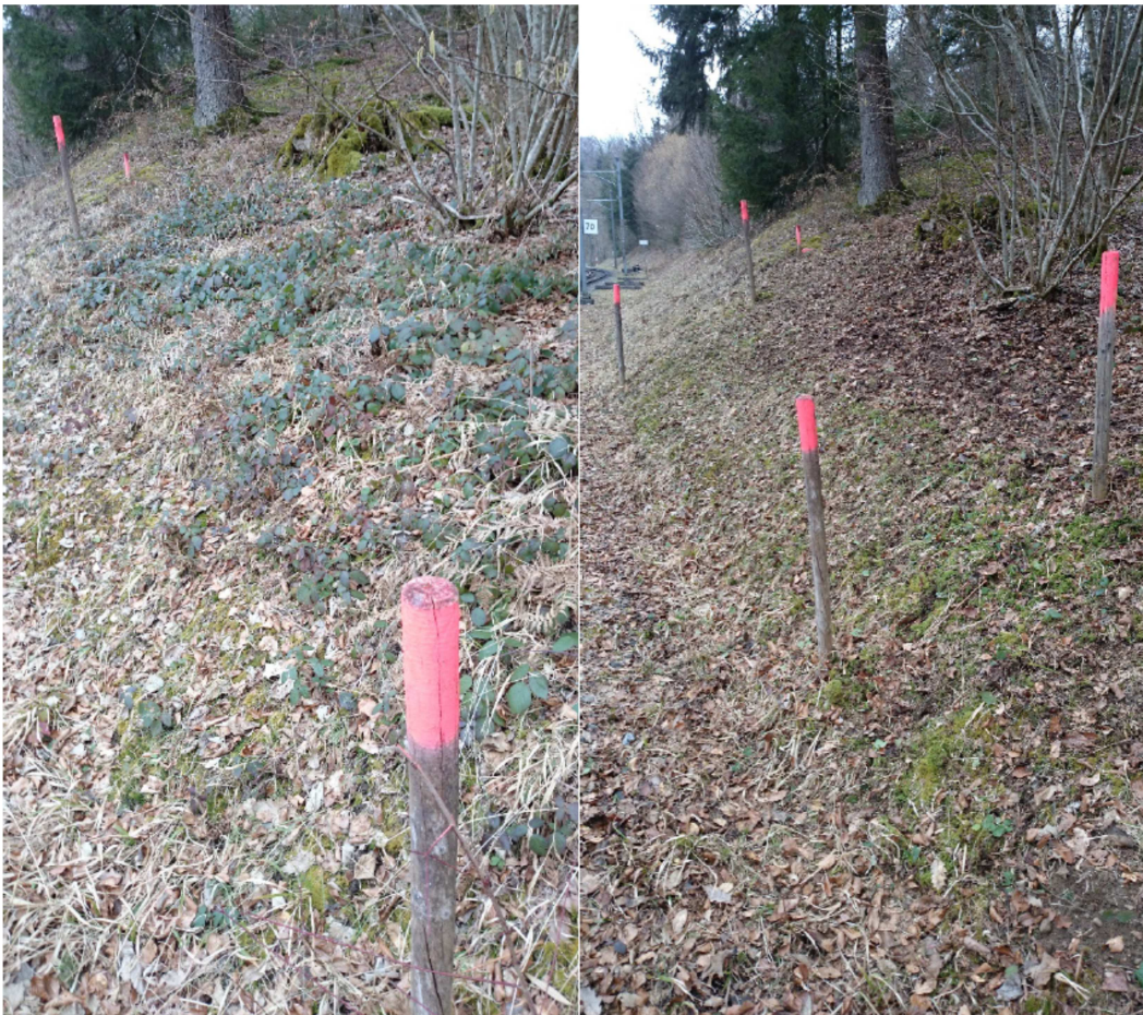
Vor dem Pflegeeingriff