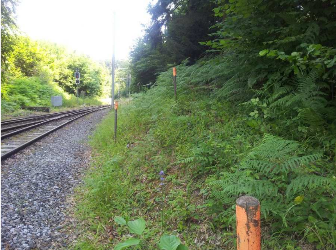
Juni 2013 nach Auspflocken