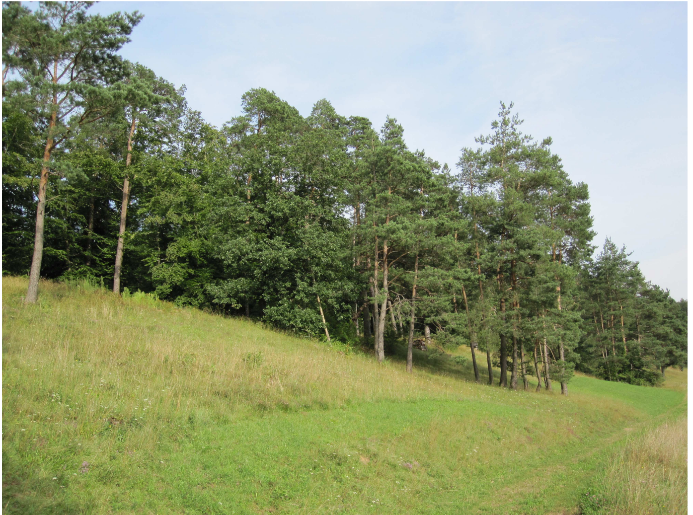
Standort Gentner 2009