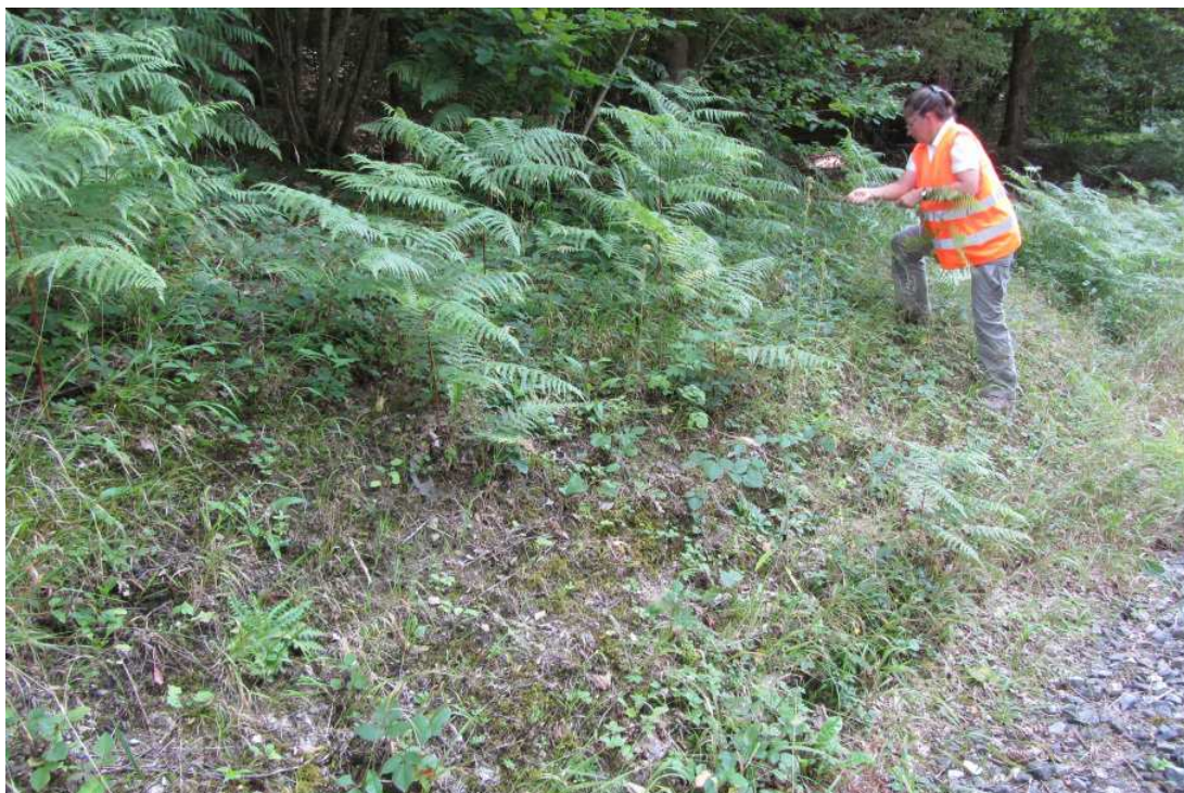
August 2012 bei einem kleinen Einsatz zur Adlerfarnbekämpfung