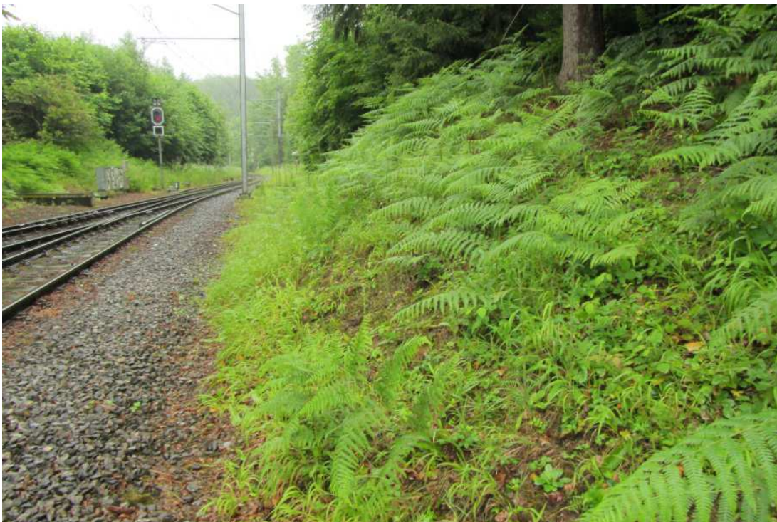
Standort Erdmannlistein Juni 2012