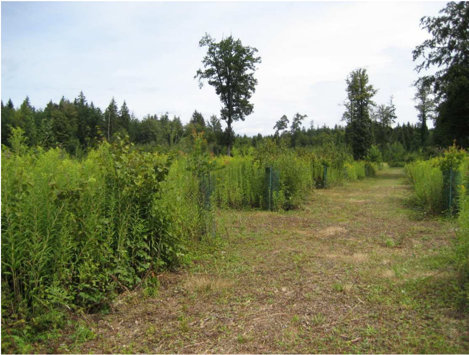
Niderholz Solhau, ZH